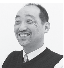
穏やかな口調で語る塾長

例えば、まずは復習しやすく分かりやすいノートのとおり方など、基礎的なことから丁寧に指導。また苦手意識を持ちや